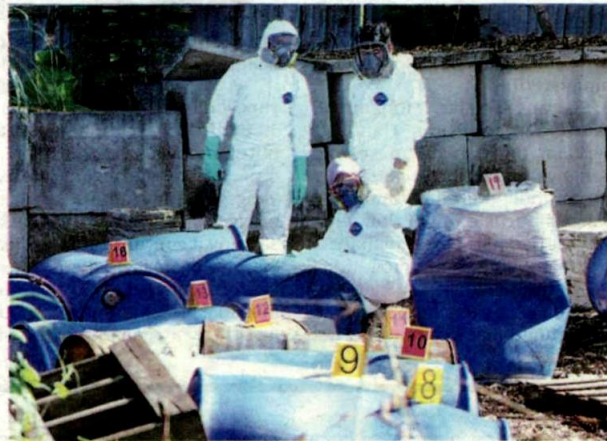
PETUGAS JAS memeriksa bahan kimia yang dibuang di rizab Sungai Langat, Taman Seri Reko, Kajang semalam.