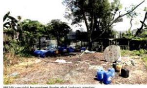
PREMIS yang tidak berdaftar disorok pelarut disyaki boleh jadi punca pencemaran Sungai Langat.