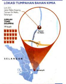
Lokasi tumpahan bahan kimia di kawasan sekitar Sungai Langat.