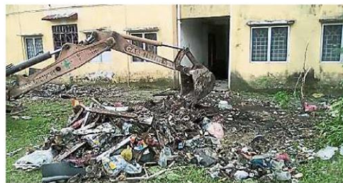
↑ 市议会动用挖泥机,把组屋楼下的陈年垃圾堆清除干净。