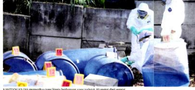
KAMTANGAN JAS memeriksa sampel bahan kimia yang ditemui berhampiran Taman Seri Beko, Kajang.