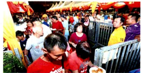
The 2018 Selangor State Chinese New Year Open House at Dataran Petaling Jaya was attended by around 11,000 guests.

For details, go to linktr.ee/cnyselangor