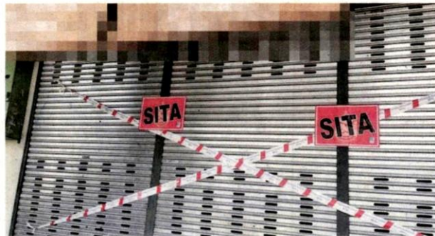
Premis pencetakan baju disita pada Selasa selepas membuang sisa bahan kimia terus ke dalam longkang.

Katanya, pesalah akan diambil tindakan di bawah Akta Industri Perkhidmatan Air 2008