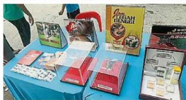
→ 市议会主办防蚊讲座,盼灌输给民众醒觉意识。