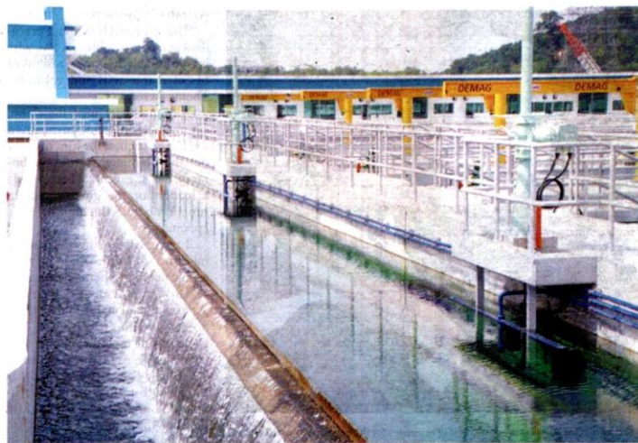
Stream B Langat 2 LRA. Selangor's treated water reserve margin currently sits dangerously below the key performance indicator set by SPAN of 10% to 15%

Sungai Rasau LRA is Air Selangor's latest project which involves RM4 billion worth of construction