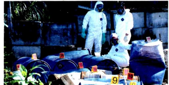
PETUGAS Jabatan Alam Sekitar memeriksa bahan kimia yang dibuang di tapak pembuangan bahan kimia di Rizab Sungai Langat, Taman Seri Reko, Kajang, Selangor semalam.

MPKJ kesan tapak buang sisa bahan kimia ke sungai