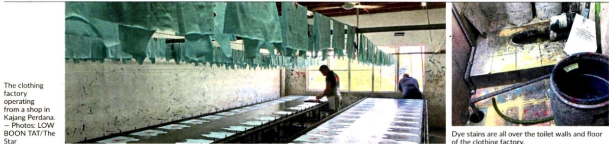
The clothing factory operating from a shop in Kajang Perdana.