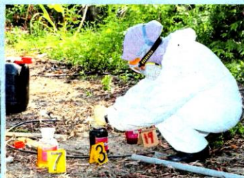
Kakitangan Jabatan Alam Sekitar menandakan sampel sisa kimia.