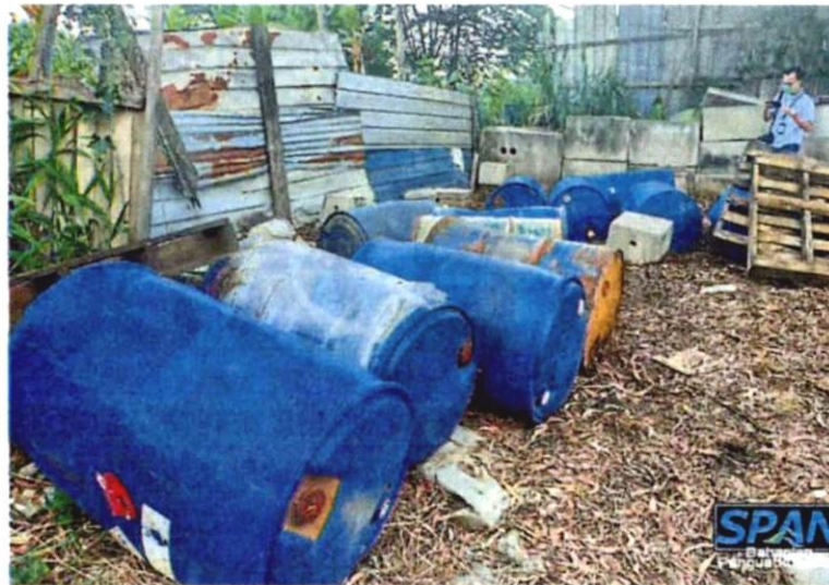
溶剂废料桶散落地上未妥善处理，恐成污染源。