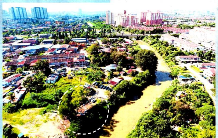
Tapak pembuangan sisa kimia yang dikesan berhampiran Sungai Langat dan kawasan perumahan di Taman Seri Reko, Kajang.

"Kilang ini didapati membuang sisa cat dan pencair ke dalam tan-