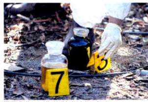
SPAS dituntut memeriksa lokasi bahan kimia terdapat di sini.

19 Stor sulit bahan cemar Premis tak berdaftar disorok pelarut disyaki boleh jadi punca pencemaran Sungai Langat Sebuah premis di Taman Seri Beko di sini, disyaki menjadi punca pencemaran Sungai Langat. Premis tersebut disorok pelarut disyaki boleh jadi punca pencemaran Sungai Langat. Suruhanjaya Persekitaran dan Alam Sekitar (SPAS) memulakan operasi pemantauan di kawasan tersebut pada 11 Februari 2020. SPAS mendapati premis tersebut tidak berdaftar dan tidak mempunyai lesen yang sah untuk beroperasi di kawasan tersebut. Menerusi hasil pemantauan, SPAS mendapati premis tersebut tidak berdaftar dan tidak mempunyai lesen yang sah untuk beroperasi di kawasan tersebut. SPAS juga mendapati premis tersebut tidak mempunyai lesen yang sah untuk beroperasi di kawasan tersebut. SPAS juga mendapati premis tersebut tidak berdaftar dan tidak mempunyai lesen yang sah untuk beroperasi di kawasan tersebut. SPAS juga mendapati premis tersebut tidak mempunyai lesen yang sah untuk beroperasi di kawasan tersebut.