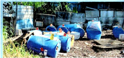
Tong yang mengandungi sisa bahan kimia ditemui tapak pembuangan haram di Taman Seri Reko, Kajang.