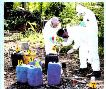
Sampel sisa kimia diambil untuk pemeriksaan.