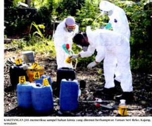
KAMTANGAN JAS memeriksa sampel bahan kimia yang ditemui berhampiran Taman Seri Beko, Kajang.