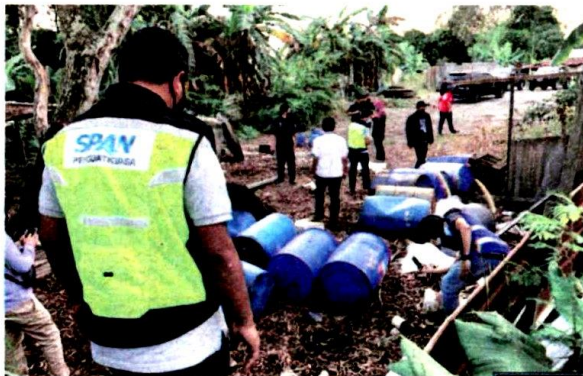
Anggota penguat kuasa SPAN memeriksa tong ditemui berisi bahan sisa berjadual di tepi Sungai Langat berhampiran Taman Sri Reko, Cyberjaya.

Bagaimanapun, Jabatan Bomba dan Penyelamat yang menjalankan pemeriksaan mendapati bahan kimia itu tumpah dalam kuantiti sedikit dan tidak membahayakan alam sekitar serta nyawa manusia.